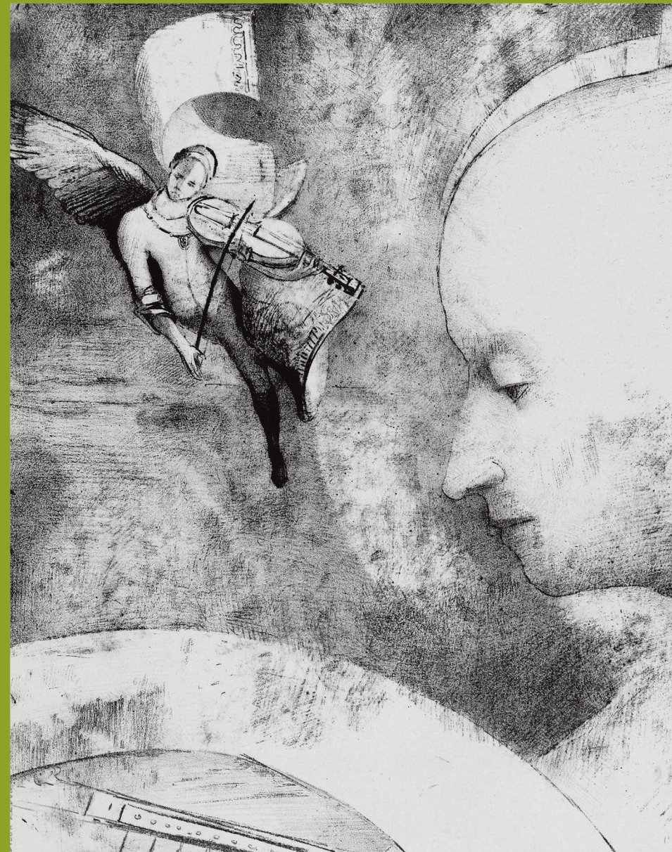
L'art céleste (De hemelse kunst) , 1894, particuliere collectie The celestial art , 1894, private collection